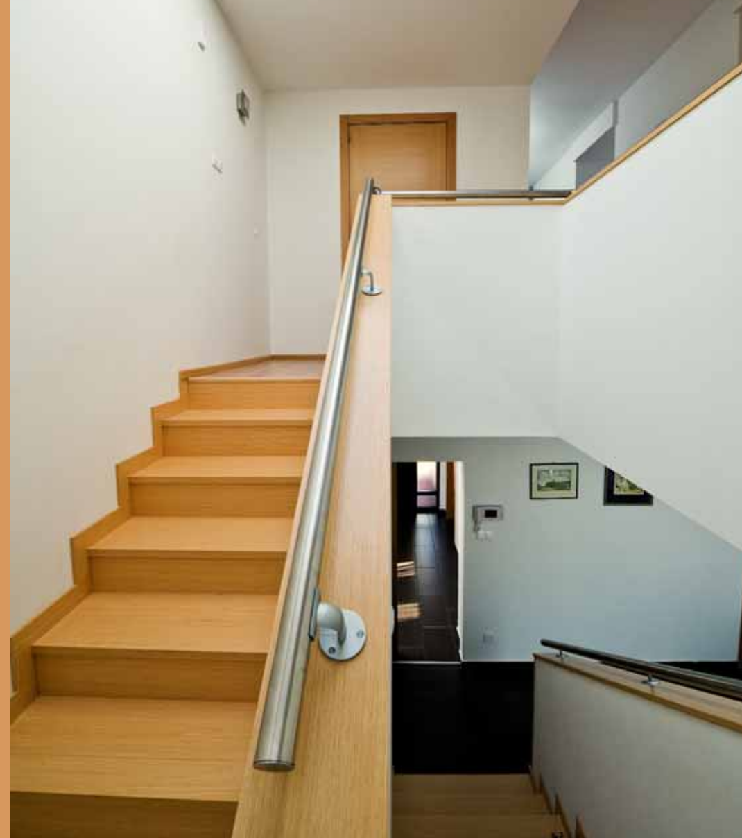
A lépcső világos és tágas a fölötté beépített bevilágítónak köszönhetően.

Építész: FÓRIS VIKTÓRIA Fóris és Társa Építésziroda Kft. Tel.: (20) 968-1022 E-mail: foris@forisestarsa.hu