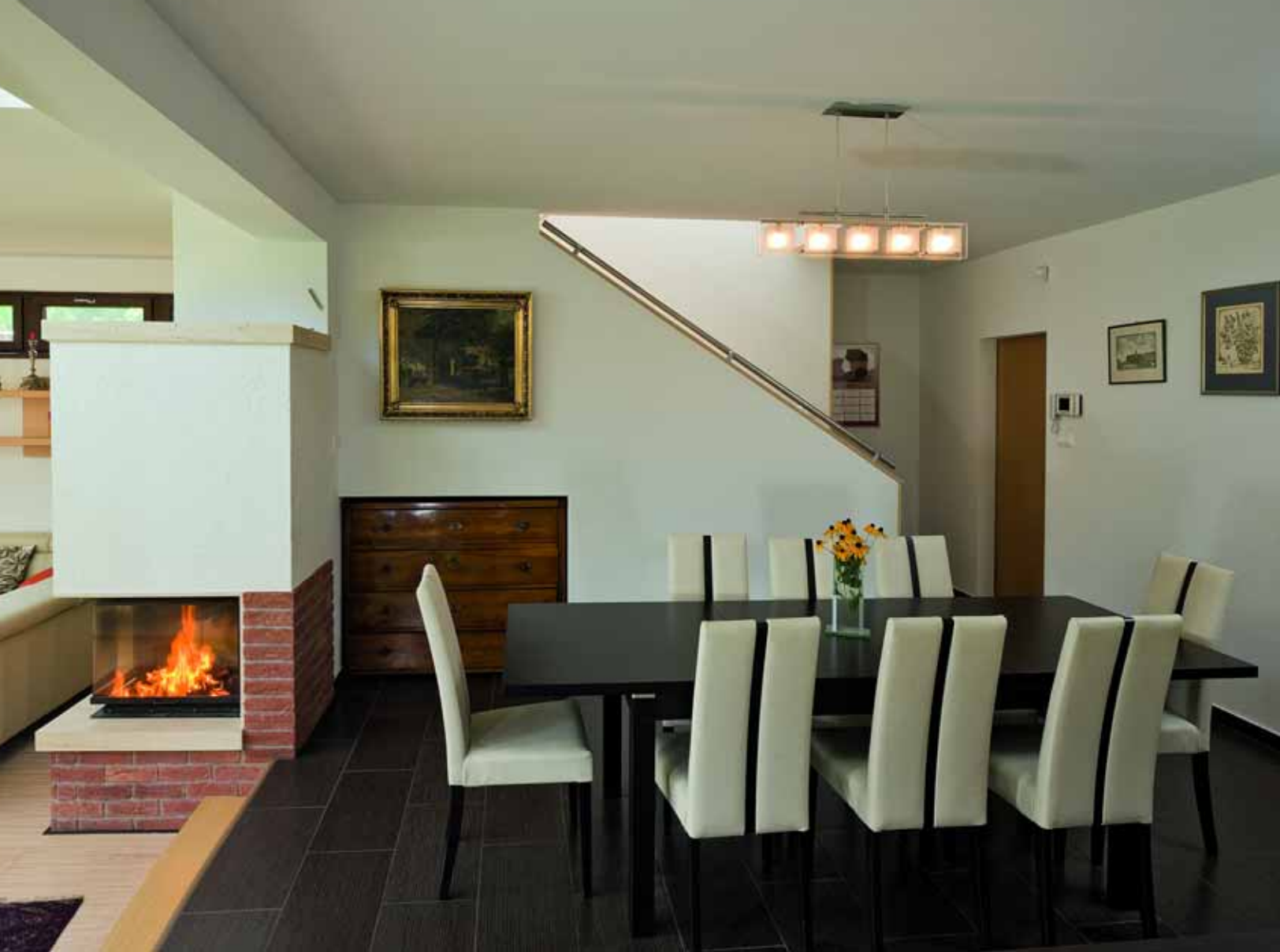
A festmény és a komód családi örökség, de tökéletesen együtt él a modern és funkcionális berendezéssel.