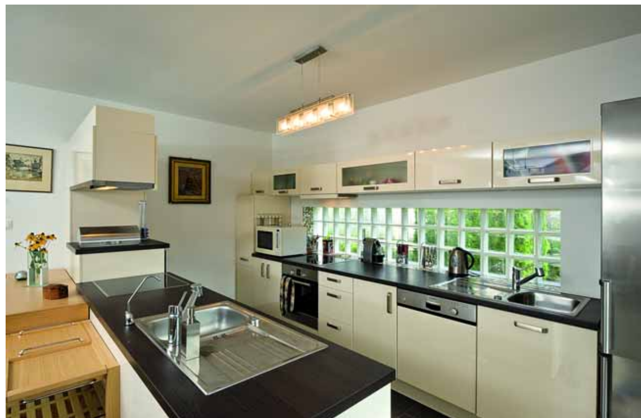
A konyha puritánul egyszerű. A munkalapot megvilágító üvegtégla lehetővé tette, hogy a felső szekrények elhelyezhetők legyenek.

Építész: FÓRIS VIKTÓRIA Fóris és Társa Építésziroda Kft. Tel.: (20) 968-1022 E-mail: foris@forisestarsa.hu