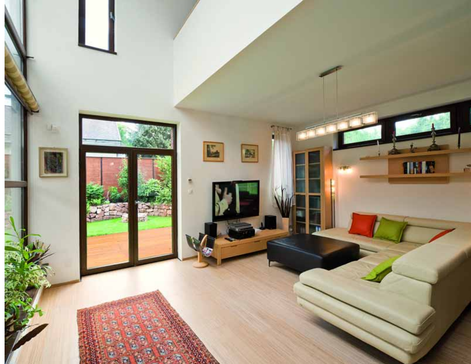
A nagy belmagasságú nappali üvegfalával és ablakaival a hátsó kertre néz.